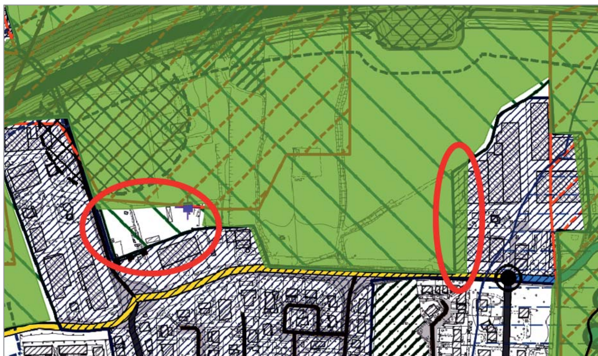
Circoscritte in rosso le discrepanze tra Plis riconosciuto e Plis rappresentato sugli elaborati di Pgt (Tav.PR02.01 della variante in esame)

ricostituire la rappresentazione del Plis PANE negli elaborati di Pgt alla individuazione di cui all'atto di riconoscimento e valutare l'opportunità di segnalare nel Pgt proposte di rettifica/ampliamento.