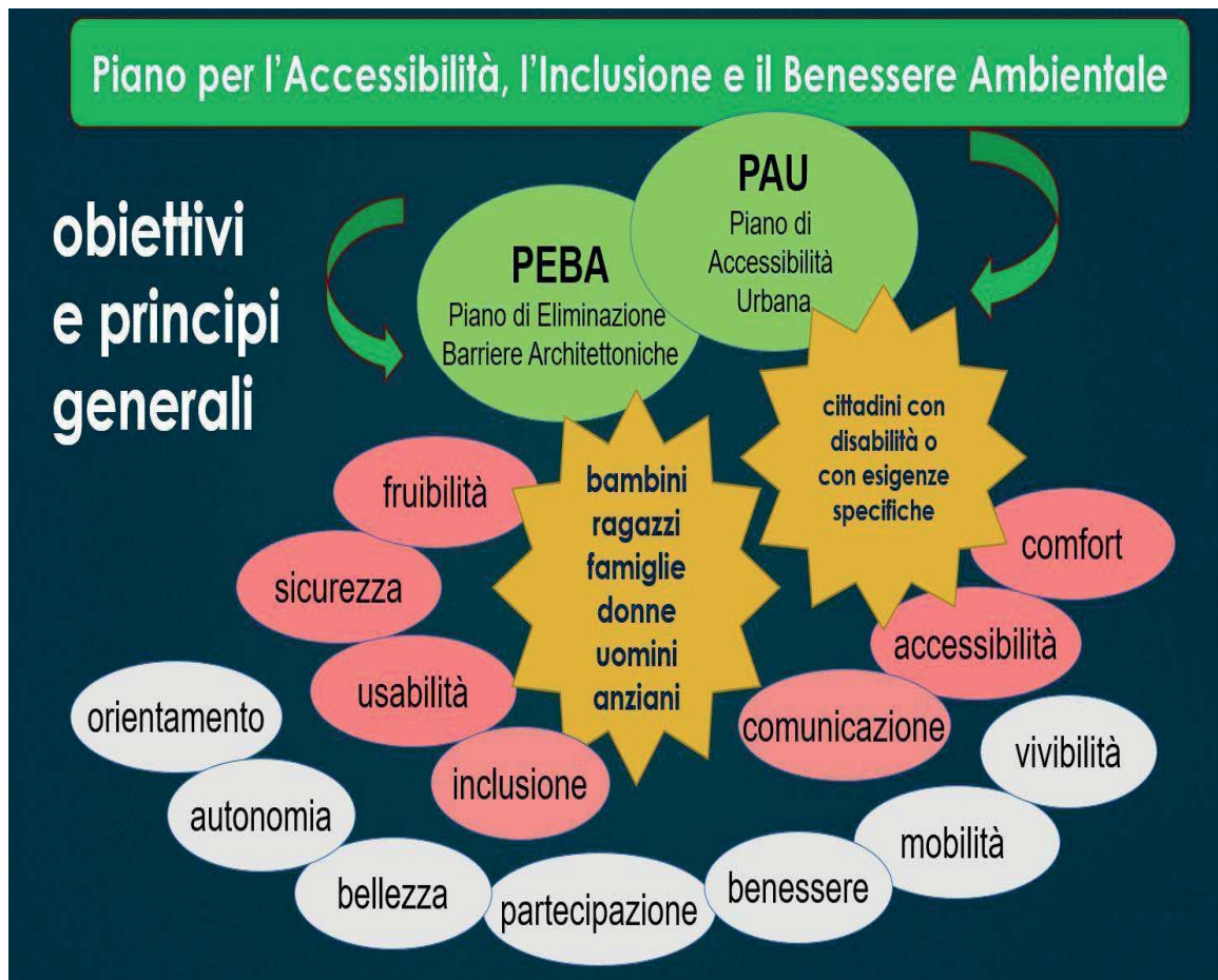
Fig. 1 – Obiettivi e principi