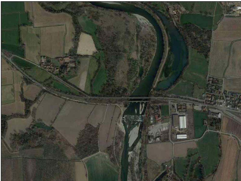
Allegato C Inquadramento ortofoto zona di intervento