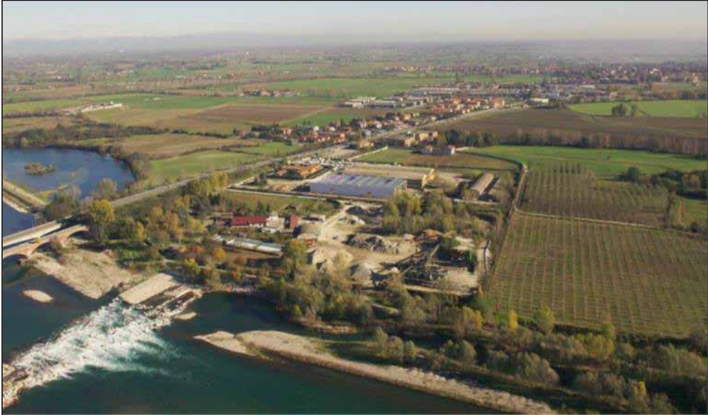
Allegato A Ripresa aerea della sponda sinistra a valle dell'area di progetto