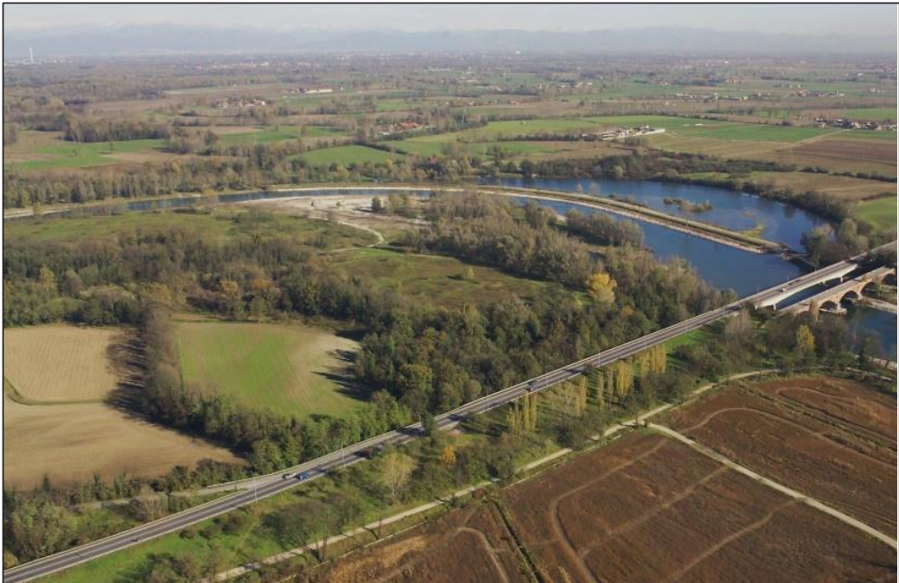
Allegato B Ripresa aerea della sponda sinistra a valle dell'area di progetto